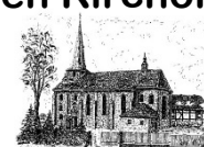
St. Laurentius Gieboldehausen