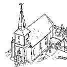
St. Matthäus Bodensee