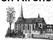
St. Laurentius Gieboldehausen