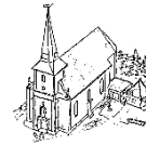
St. Matthäus Bodensee